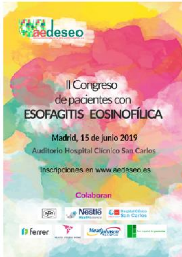
Cartel informativo del Congreso.