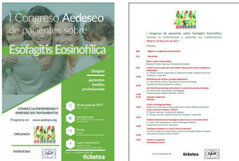
Ilustración 1. Cartel y Programa Congreso I Pacientes EoE AEDeseo

Aedeseo agradece la colaboración completamente desinteresada de todos los profesionales mencionados y el patrocinio de los laboratorios Dr Falk 2 que costearon el alquiler de la sala y los equipos técnicos y ofrecieron un servicio de desayuno a todos los asistentes.