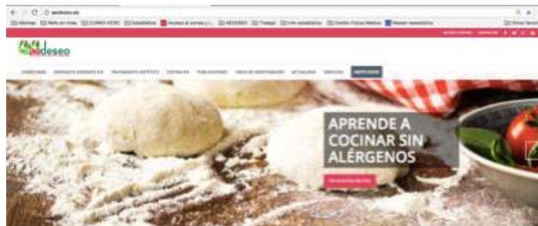
Ilustración 7. Imagen Página Web 3