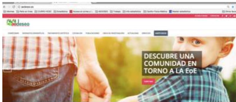
Ilustración 6. Imagen Página Web 2