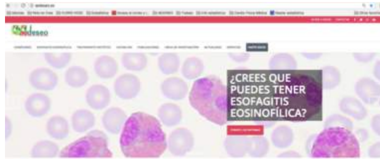
Ilustración 5. Imagen Página Web 1