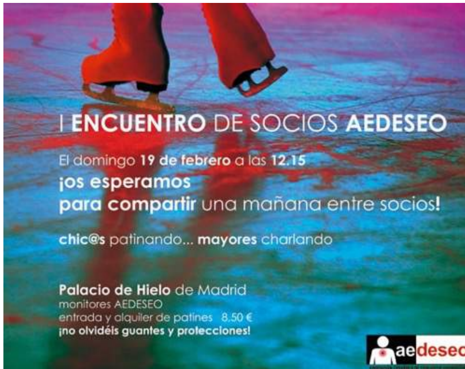
Ilustración 3. Cartelería Encuentro Socios. Palacio de Hielo de Madrid

El 17 de febrero se celebra un encuentro de socios en el palacio de Hielo de Madrid.